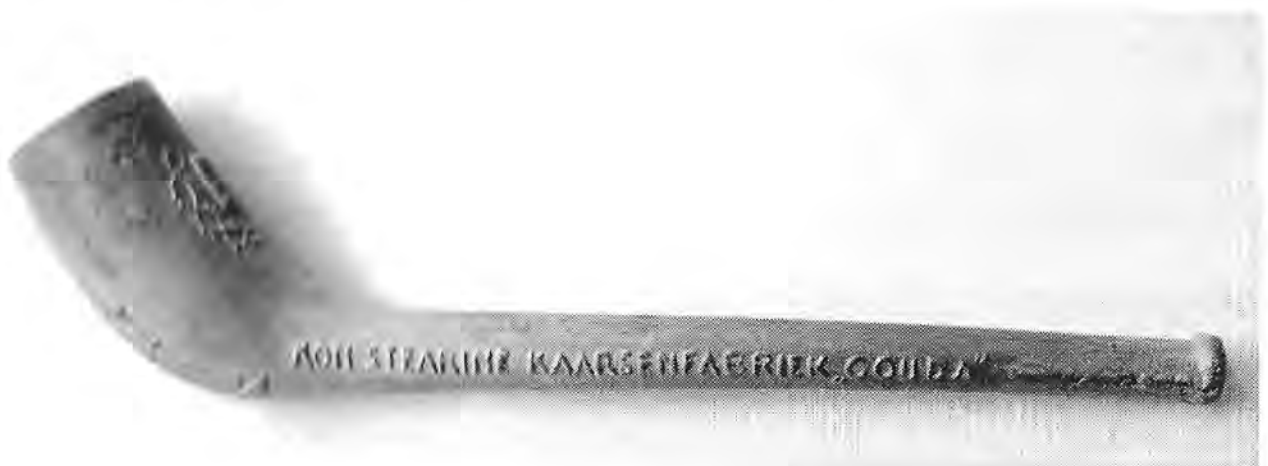
Afb. 2, Lange hoornsigaar met firmanaam.